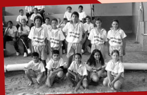
CPEIPS Sagrado Corazón

La fase final se realizará por medio de un sorteo, donde se enfrentarán los cuatro equipos clasificados, para disputar los dos ganadores la gran final.