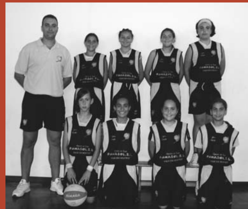
Viajes Pansol-Minibasket femenino