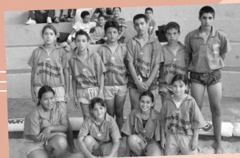
CEIP Pablo Neruda