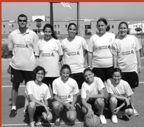
Helvetia Previsión - Cadete femenino