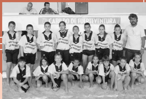
CEIP Millares Carló