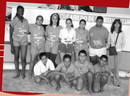
CEIP San José de Calasanz