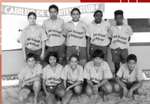
CEIP Francisco Artilles